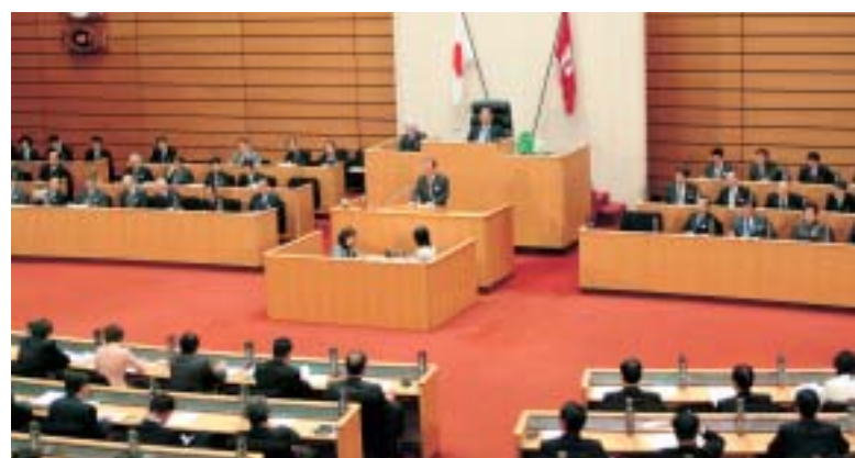
愛知県議会 平成17年2月定例会

平成17年度の協議会予算が確認されました。総額は歳入・歳出それぞれ6,800千円で、繰越金や両市町からの負担金等でまかなわれます。予算についても、合併日の前日9月30日までの6か月の執行期間となります。