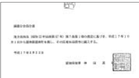
廃置分合処分書の写し