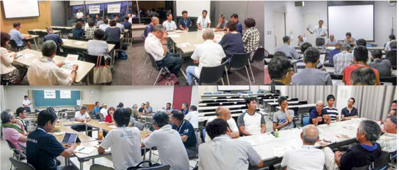
3会場で、49人の方にご参加いただき、多くの意見をいただきました。

8月2日(木)：田原文化会館 201 会議室・赤羽根市民館会議室・渥美文化会館大会議室