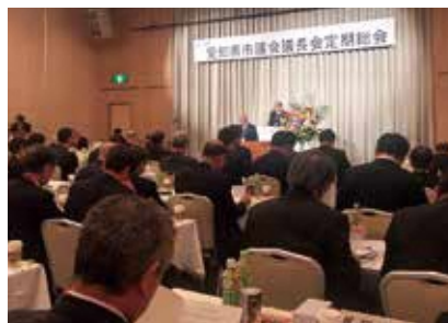
愛知県内の市議会の議長・副議長が集い、各市・市議会の課題などについて議論しました。