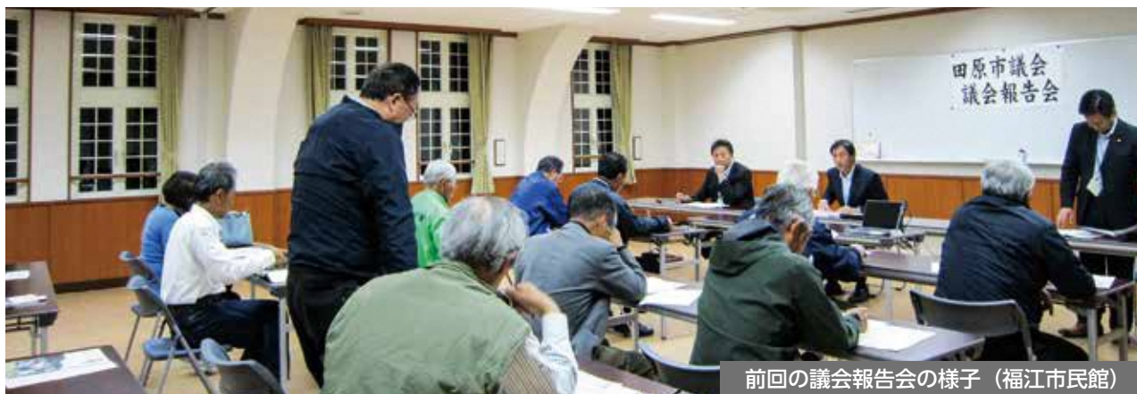
前回の議会報告会の様子 (福江市民館)