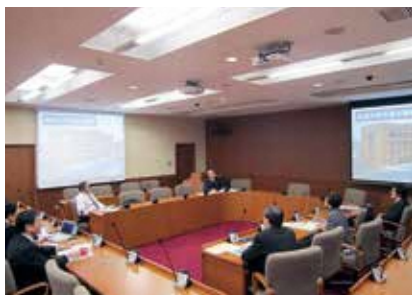
2月の改選で、新たに議員となった5名を対象に、各分野の現状と課題などについて5日間の研修を行いました。